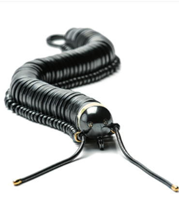
Fie Bodenhoffs tusindben